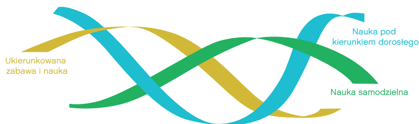
Rys. 1 — Zintegrowane podejścia do nauczania i uczenia się

Nauka oparta na zabawie oraz podejścia, takie jak nauka oparta na dociekaniach, nauka aktywna i nauka przez doświadczenia, zostały opracowane na podstawie tych samych teorii nauczania. Ich kluczowym założeniem jest współpraca uczniów i nauczycieli w formie partnerstwa mającego na celu wspólne tworzenie wiedzy. W przypadku wspomnianych systemów środowiska nauczania są świadomie projektowane w taki sposób, aby maksymalnie sprzyjać kreatywności, interakcji społecznej, eksperymentowaniu i radości z nauki.